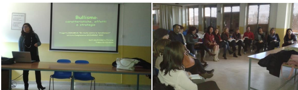
Elevii și gazdele lor

Profesorii participanți din țările partenere au luat parte la o întâlnire de lucru coordonată de un psiholog invitat de școala din Trabia. Acesta i-a format pe profesori în legătură cu fenomenul de harcèlement. S-a definit termenul, s-a analizat tipologia și s-au reperat comportamentele caracteristice, s-a vorbit despre prevenire și acțiune în caz de discriminare și comportament neadecvat. Toate informațiile oferite vor fi folosite pentru realizarea activităților ulterioare, cum ar fi reperarea prezenței acestei teme în manuale și cărți, documentarea asupra acțiunilor de prevenire și de luptă împotriva fenomenului în fiecare țară, analiza rezultatelor chestionarului de evaluare diagnostică ce se va realiza în Grecia, în aprilie 2017.